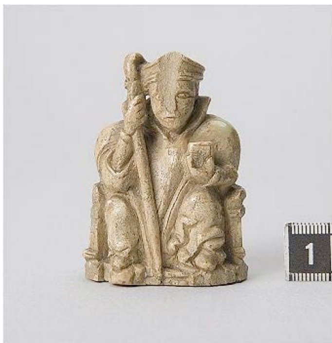
Schackpjäs av ben från Stegeborgs slott. 10

Själva arbetet vid Skällvik leddes dock i praktiken ej av Ekhoff och av bevarad korrespondens, som redovisas på annan plats på hemsidan, är till och med tveksamt huruvida Ekhoff ens besökte Skällvik.